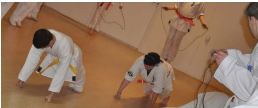
Intensiv træning i Kyokushinkai Himmerland.