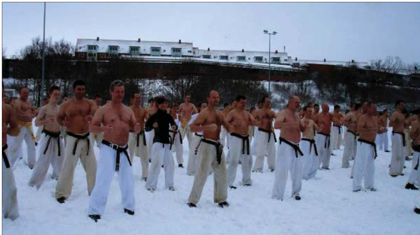
Hård træning giver varmen i sneen.

Et hurtigt kig rundt i hallen afslører smerte i forskellige variationer. Enkelte karatekaer er begyndt at sparke lidt lavere, andre viser tænder. En enkelt strækker sit venstre ben, der ryster af krampe. Strækket bliver holdt et par sekunder, så fortsætter han. Osu no seishin! Giv aldrig op!